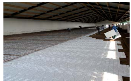
Verlegung des IN-Systems im Stall.

Neu ist auch die Fußbodenheizung IN-System, die eine gleichmäßige Wärmeverteilung im Bodenbereich des ganzen Stalls garantiert. Die Fußbodenheizung wird durch Regelstationen, Heizkreisverteiler und Raumthermostate effizient gesteuert. Sie bietet den Tieren beste Lebensbedingungen von Anfang an. Tiergesundheit und Fleischqualität werden