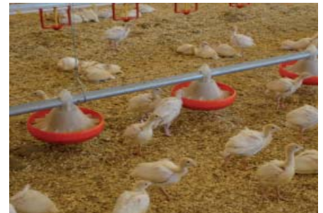
Die Futterschale Feed Point eignet sich optimal für die Putenaufzucht.

wird die Feed Point vom 1. Tag an sehr gut angenommen. Die Schale gewährleistet eine problemlose Aufzucht der Putenküken bis zur 6. Lebenswoche. Das Futterrohr ist durch eine obere Falz sehr stabil. Der durchsichtige Konus erleichtert die Futterkontrolle. Seitliches Kippen der Futterschale lässt eine einfache Reinigung zu. Die Futterschale ist exzellent für die ringfreie Aufzucht geeignet.