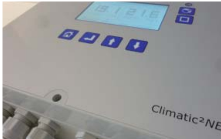
Konzeptansicht Climatic 2 NET.

Die Besonderheit dieses neuen Klimareglers: Alle Climatic 2 NET-Einheiten können miteinander vernetzt werden, so dass man von ei-