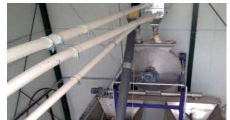
Wiegemischer mit zwei Vorratsbehältern.

werden. Je nach Bedarf kann dieses CCM-Schrot mit einem Frontlader in die CCM-Annahme gefüllt werden. Die Annahme kann dabei im Gebäude oder auch draußen im Freien installiert werden, da diese Frost unempfindlich ist. Es ist lediglich ein Regenschutz erforderlich. Über ein Förderschneckensystem wird das CCM zum Wiegemischer in der Futterzentrale transportiert. Dieser vermischt das CCM zusammen mit weiteren Futtersorten und dosiert das fertige Gemisch in einen oder mehreren Vorratsbehältern aus. Über diesen Vorratsbehälter wird mit einem Spiralsystem das Futter in die