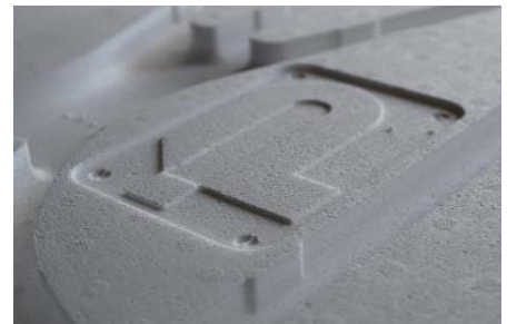
Die ESP-Fußbodenheizungsplatte „IN-Dämmelement“.

Prüllage präsentiert auf der EuroTier außerdem die neueste Applikation der PR-Feed-Control. Mit der PR-F-Matic ist nun auch eine Flüssigfütterung über die PR-Feed-Control realisierbar. Mit einem Trogsensor ist sogar eine Fresszeitsteuerung möglich. Dabei werden die Trogsensoren kontinuierlich abgefragt und die Zeit bis zur Leermeldung für jeden Trog gemessen. So kann der Landwirt Sollzeiten sowie Zu- und Abschläge zu jeder Fresszeit festlegen.