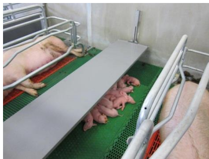
Easy Baby Climate