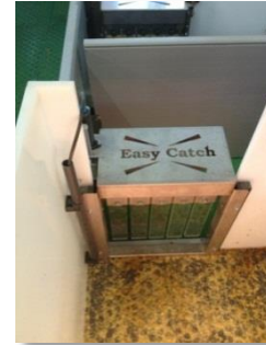
Easy Catch (patented)