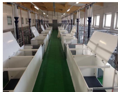
Universität Wien, Österreich