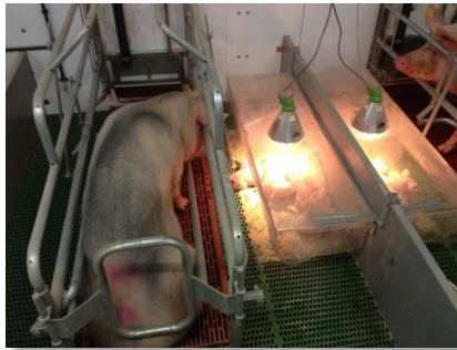
Easy Climat biggen