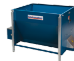
Maschine CH3-350 HD