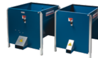
CH1-180 & CH2-220