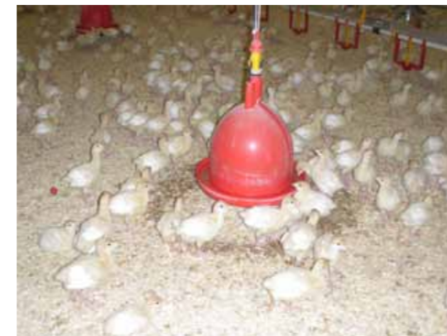
Rundtränke für die Putenaufzucht

Mit Hilfe des Aufhängesystems ist es ebenfalls möglich die Rundtränken anzuheben und auf das Wachstum der Tiere anzupassen. Durch Drahtseile und Deckenumlenkrollen werden die Tränken mit einem zentralen Seilzug verbunden und können über Hand- oder Elektrowinden angehoben und herabgelassen werden. So können diese auch nach dem Ausstallen zum Reinigen unter die Decke gefahren werden.