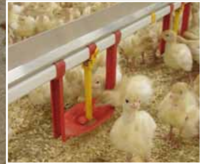
Starterkugel in Aufzuchtchale

Perfekte Versorgung mit frischem Trinkwasser.