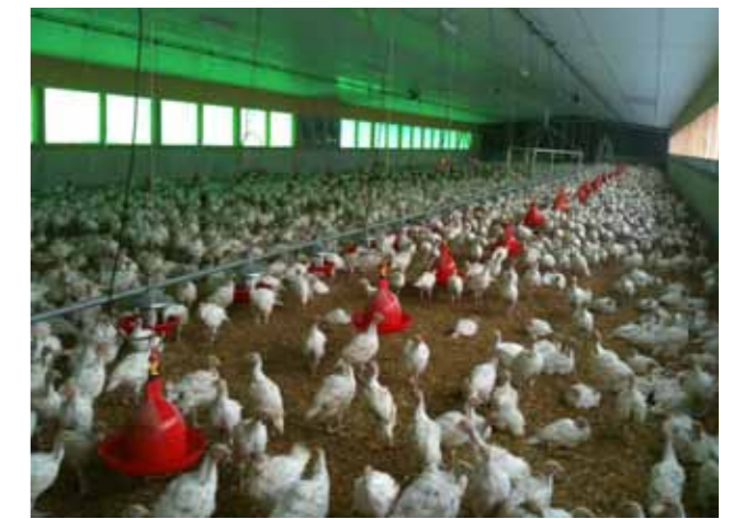
Rundtränke für die Putenmast